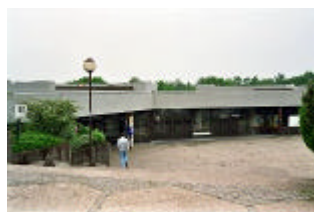
Grands Amphithéâtres Bâtiment B7a - Amphi 500 Esplanade de l'Université, 1